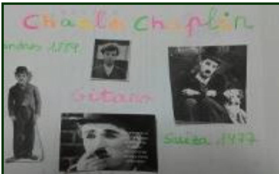
(Imagen del mural realizado por un alumno en el taller sobre Charles Chaplin).