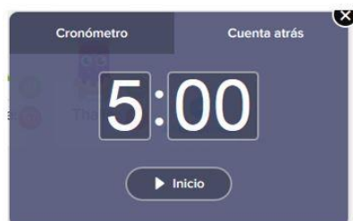
Figura 5. Temporizador