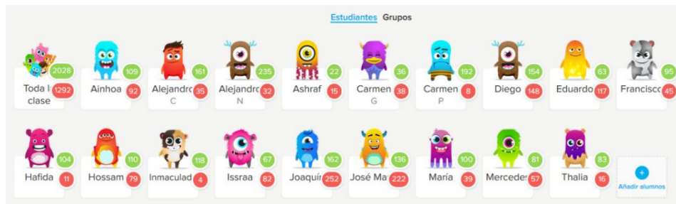
Figura 2. Creación de alumnos con diferentes avatares