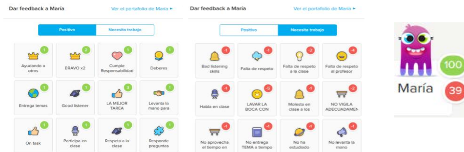
Figura 3. Insignias positivas-negativas y avatar con puntuaciones que podrán constatar los padres