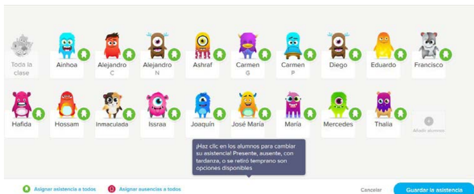
Figura 4. Control de asistencia