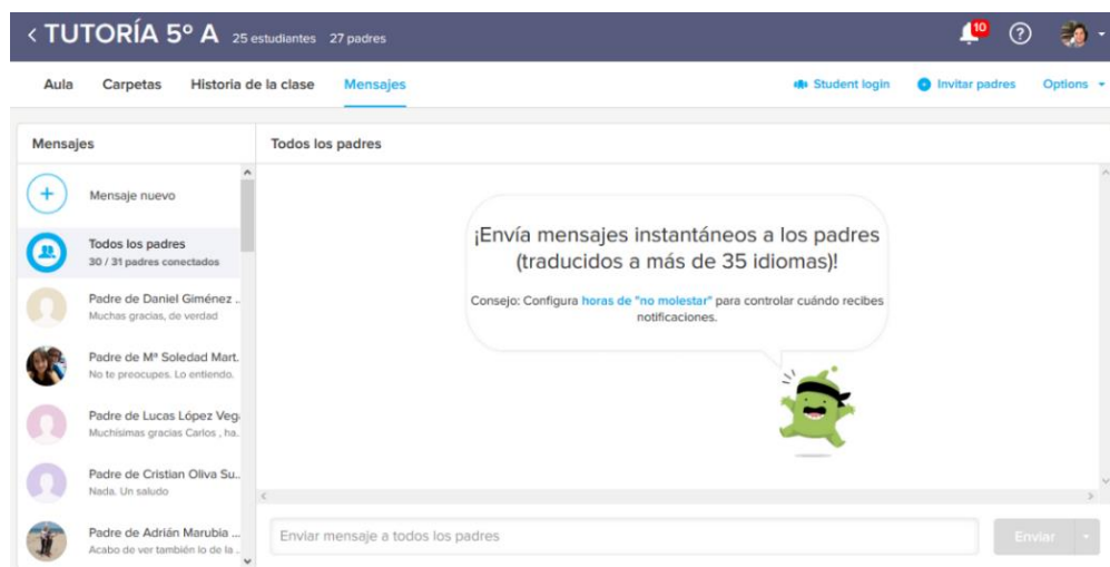
Figura 10. Mensajes