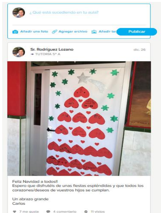
Figura 9. Historia de la clase