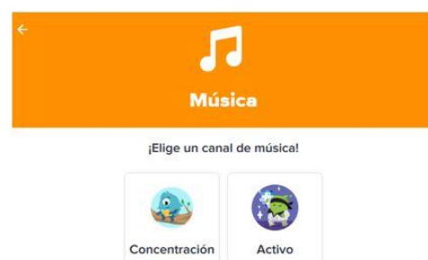
Figura 6. Selección de música (Concentración o activo)