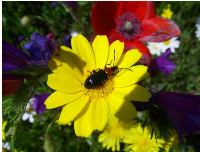
Figura 1. Coleóptero polinizando una asterácea.

Para finalizar, ya sea en el espacio verde o de regreso al aula, se procederá a realizar una asamblea y puesta en común de la información que han recopilado y sobre lo que han aprendido durante la actividad, destacando los aspectos que más les hayan gustado. Como resultado, el alumnado será capaz de identificar diferentes tipos de polinizadores y flora entomófila además de tomar conciencia de la gran biodiversidad que les rodea. Es importante que el docente o educador ambiental incida en la importancia de estos insectos para el correcto funcionamiento de los ecosistemas, fomentando el respeto por el medio natural.