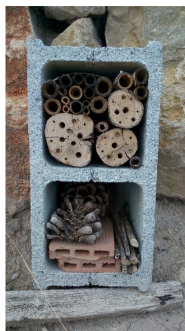
Figura 2. Hotel de insectos en el Jardín de Flora Autóctona de la Universidad de Jaén.

Posteriormente dedicaremos un tiempo a la construcción de nuestro propio hotel para insectos, siendo recomendable que tengamos preparado todo el material necesario. El hotel de insectos es una estructura a modo de caja o estantería de madera o ladrillo que permite ubicar y sostener elementos naturales que servirán de cobijo y hogar a numerosos insectos (Figura 2). Es de destacar que cada insecto tiene su nicho ecológico y necesidades específicas, por lo que, en la fase de diseño, se deberán tener en cuenta diversos tipos de materiales (piñas, ramas, troncos de diferentes tamaños, cañas, etc.) para alojar a la máxima biodiversidad de insectos polinizadores posible. El alumnado, además de diseñar su hotel de insectos, deberá pensar en la ubicación ideal para este elemento. Aquí el docente o educador ambiental deberá de ir guiando el trabajo realizado por los participantes, proporcionando una serie de directrices para su correcta construcción y ubicación (zona con flora entomófila en las proximidades, protegida del viento, orientada al sur, y elevada unos 30 cm del suelo).