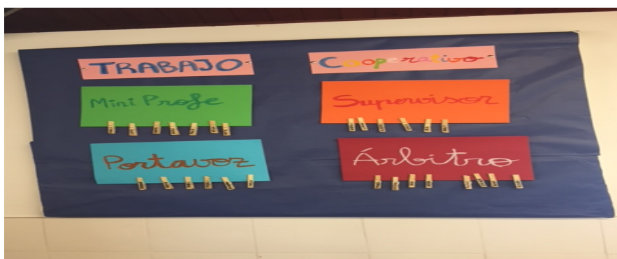
Imagen del cartel para la organización del trabajo cooperativo para la actividad nº1.