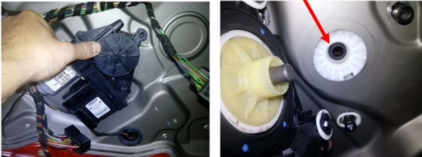
Estriado del elevallunas

El montaje de la unidad nueva y el revestimiento se hará de la forma inversa al desmontaje.