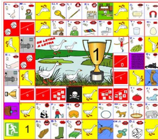
Figura 1. Tablero del "Juego de la oca de Arasaac".

Se trata de un tablero formado por 65 casillas en las cuales se distribuyen las letras del abecedario, los puentes, las ocas, el pozo y la calavera. Cuando caes en cualquiera de las letras del abecedario, tienes que decirla en voz alta, así como mencionar dos palabras que comiencen por esa letra. En el resto de casillas, se jugaría como en el tradicional juego de la oca. (Fernández, 2013). A continuación, se encuentra la Figura 1 que representa "El juego de la oca de Arasaac".