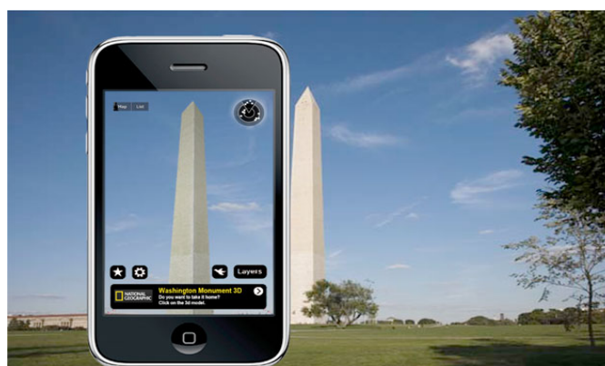
Figura 2.4. Ejemplo de nivel 2 de RA con utilización de GPS