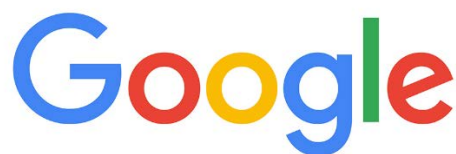
Figura 3.6. Símbolo de la aplicación de Google

En caso de buscar información con mucho más rigor y contrastada existe la variante llamada Google académico el cual nos facilita artículos e investigaciones de diferentes universidades, autores, así como bibliografía de todo tipo.