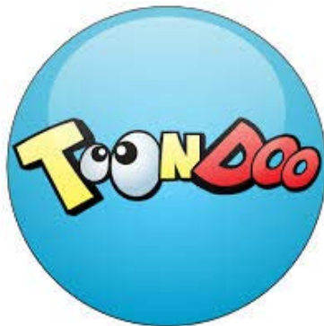
Figura 3.5. Símbolo de la aplicación de Toondoo

Esta app nos permite trabajar de una manera diferente e interactiva los contenidos curriculares del cómic tanto en el área de Lengua y Literatura como en Educación Artística. Los cómics creados pueden ser guardados y visualizados únicamente por el usuario, compartirlos para que todo el mundo pueda verlos o incluso imprimirlos. También contiene una faceta social ya que es posible compartir los cómics para ser visualizados en diferentes redes sociales.