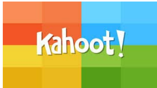
Figura 3.4. Símbolo de la aplicación de Kahoot!

Uno de los formatos más comunes a la hora de utilizar esta app es el de los concursos en el aula para aprender o reforzar el aprendizaje y donde los alumnos/as son los concursantes. La forma de acceder para los alumnos/as es crear su avatar y contestar a una serie de preguntas por medio de un dispositivo con conexión a Internet.