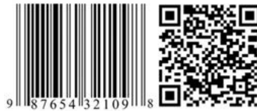
Figura 2.2. Ejemplo de nivel 0 de RA en códigos de barras y QR

Nivel 0: se utilizan códigos de barras, códigos 2D o código de reconocimiento de imágenes aleatorias. Dichos códigos son hiperenlaces a otros contenidos (funcionan como un enlace normal sin necesidad de teclear, pero no tienen registro en 3D)