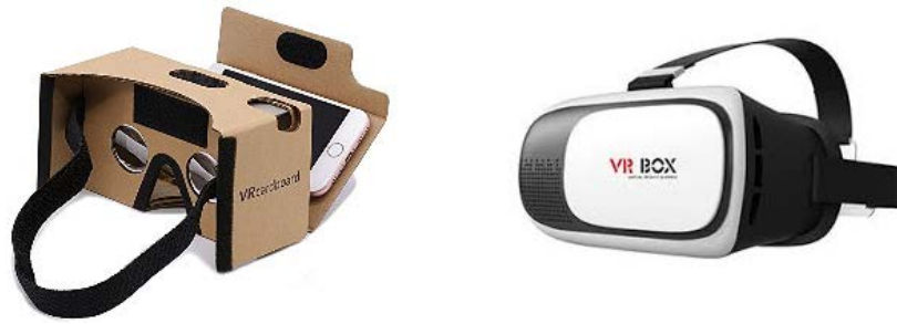
Figura 2.6. Ejemplo de varios tipos de gafas de RV

Gracias a su uso, es posible optimizar los procesos de aprendizaje y aumentar el interés y la participación de los discentes. El maestro/a adapta la tecnología a los alumnos/as y contenidos. Así, por ejemplo, en una clase de Ciencias Sociales sería posible interactuar con un planeta, en Literatura mover a los personajes por el escenario de un cuento, realizar excursiones sin salir de clase, ampliar la información de monumentos en salidas del centro, etc.