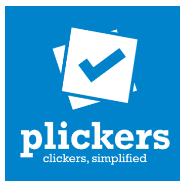
Figura 3.3. Símbolo de la aplicación de Plickers

Plickers es una app de Realidad Aumentada que se encuentra dentro de las clasificadas anteriormente para la elaboración de encuestas. Este sistema permite conocer lo que saben los alumnos/as a tiempo real, siendo la gran novedad que todos responden a la vez a través de una tarjeta que ofrece un feedback directo, apartándose de la tradicional manera de evaluar en la que se lanza una pregunta al aire y solo contesta un alumno/a.