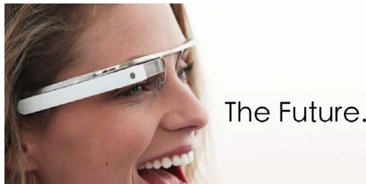
Figura 2.5. Ejemplo de nivel 3 de RA con las gafas Google glass .

En lo que se refiere a la RV, la Facultat d'Informàtica de Barcelona (2008) la define como “un sistema informàtico que genera representaciones de la realidad, que de hecho no son más que ilusiones ya que se trata de una realidad perceptiva que se produce de forma completamente digital.”