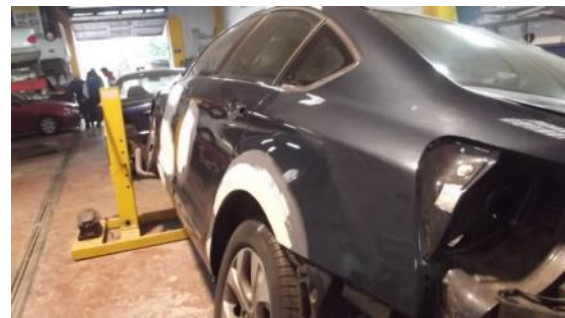
Reparar e pintar lateral esquerdo.

2. Outra clasificación que debemos coñecer sobre os talleres é, sobre a relación que teñen estes coas marcas (Seat, Ford, Renault, Feubert, Bosch Car Service etc.). A clasificación sería a seguinte: