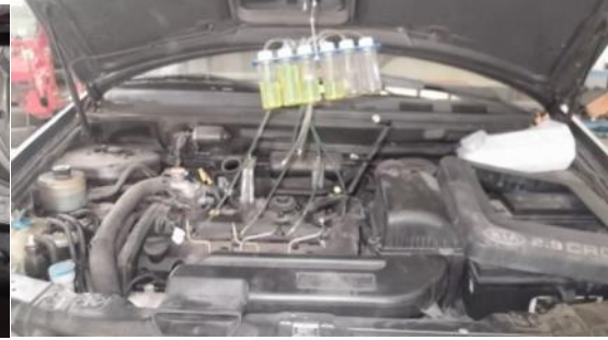
Diagnose fuga inyectores

Talleres de electricidad-electrónica: trabajos de reparación o sustitución no equipo eléctrico-electrónico del automóvil.