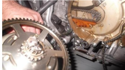
Avaría mecánica en distribución