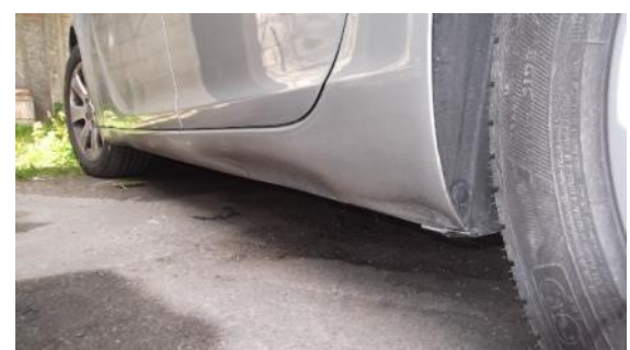
Reparación estribo inf. esquerdo

Polo normal, un taller de carrocería tamén soe estar asociado e homologado para realizar tarefas de pintura tendo así, persoal cualificado para as dúas tarefas.