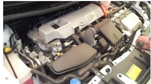
Diagnose vehículo eléctrico

Talleres de carrocerías: Realizan trabajos de reparación ou substitución de elementos de carrocería non portantes, guarnicións e acondicionamento interior e exterior dos mesmos.