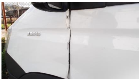
Reparación aleta dianteira esquerda.

Estes talleres están homologados para reparaci3ns ou substituci3ns de elementos amovibles e fixos da carrocería, pero non para realizar traballos de mecánica nin eléctricos.