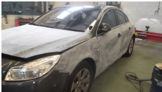
Pintura superficial de varias pezas.

De pintura: traballos de pintura, revestimento y acabado de carrocerías. Estes talleres polo normal están asociados os talleres de carrocería, quero dicir con isto, que normalmente están homologados para traballos de carrocería e pintura conxuntamente