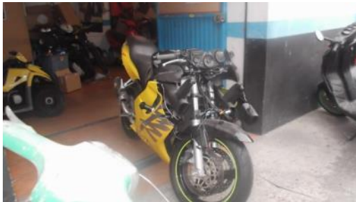
Reparación carrocería dunha moto

Talleres de motos: son talleres especialistas neste tipo de vehículos de dúas rodas, nos que se reparan e venden motos de todo tipo, incluso Quads ou coches sen carné, os cales están hoxe en auge para determinado tipo de clientes. Son talleres que se dedican a mecánica, electricidade e carrocería e pintura. Poden ser oficiais ou independentes. Os mais pequenos que son os maioritarios, os traballos de pintura soen contratalo con outros talleres.