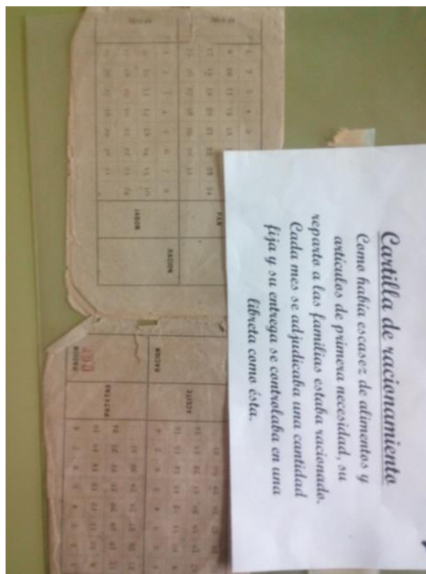
Imagen 4. Cartilla de racionamiento F.P.