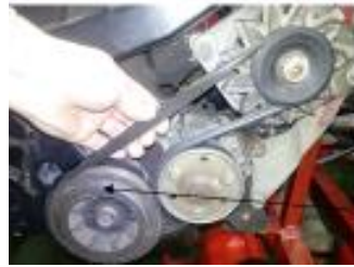
Polea do cigueñal

Para facer traballar estes elementos, a correa toma movemento do motor por medio da polea montada no cigueñal no lado distribución.