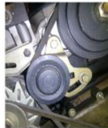
trapezoidal en v

Diagnosticar avarias na correa auxiliar: O tratarse dunha correa de goma, esta sofre deterioro tanto o funcionar como o estar parada. Este deterioro pode producir gritas, cortaduras ou contaminación con líquidos, que poden producir ruídos estraños en momentos determinados de funcionamento ou rotura da mesma.