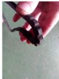
trapez v con dentes