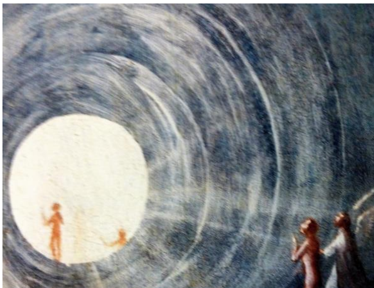
Fig.5 Detalle de La Ascensión al Empíreo (el Paraíso): uno de los cuatro postigos de El Bosco referidos al Más allá , conservados en el Palacio Ducal de Venecia. Foto de elaboración personal.

En la esfera y en el detalle de la fig.3 se ven rostros del Dioniso habitual (ref. los rincones superiores) y posiblemente de su opuesto Cristo, y multitud de serpientes conformando los círculos; el ánge l está poseído: su ala izquierda y la capa son rostros de Dioniso, quien también puede verse en la expansión del círculo blanco y de sus moradores: es, entendemos, otra interpretación de El Bosco de la Teogonía órfica : Dioniso-serpiente, dios primigenio neutralizador de los Contrarios, poseído su opuesto esencial en la obra de El Bosco, es representado como símbolo de la Unidad Final del mundo en el dios primordial : "... como afirma Filolao, filósofo pitagórico, « la armonía sólo nace de la conciliación de contrarios... »" (apud https://es.wikipedia.org/wiki/Armonía_de_las_esferas#Véase_también ).