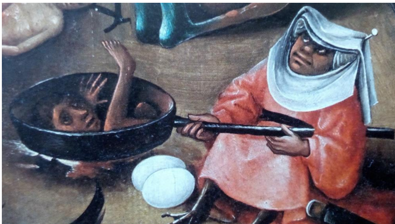
Fig.2 El niño-dios-Dioniso-Zagreos en el proceso de cocción después del sparagmós .

Esta interpretación órfica es apoyada por las siguientes imágenes de la tabla central de El Juicio Final :