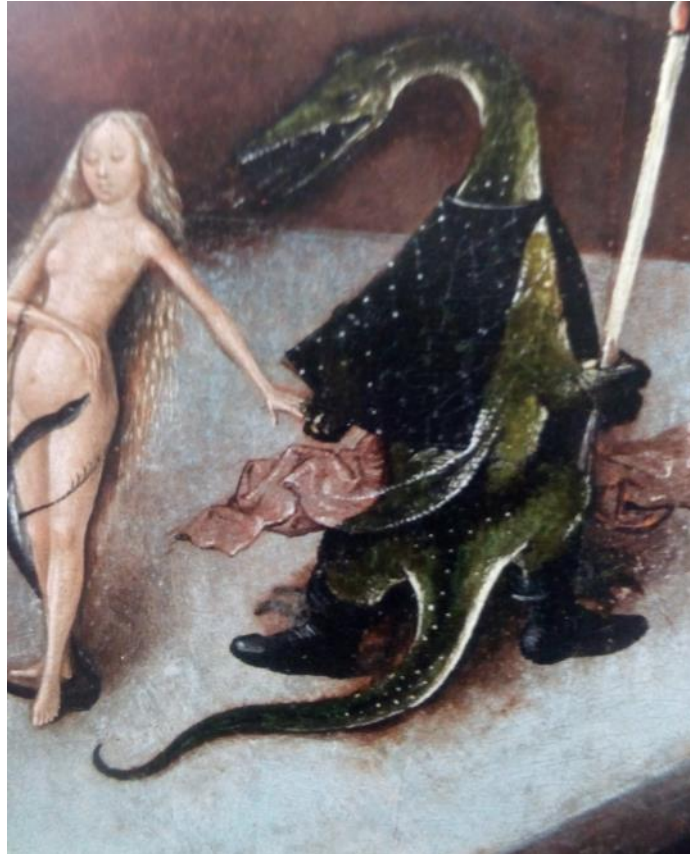
Fig.6 La dulce árretos Core-Perséfone, embarazada (evoca a Eva pisando la serpiente) y el fiero Dioniso. Ubicación: espacio central de la tabla central de El Juicio Final .

En la fig.6 , a la derecha, vemos una imagen que completa la del dragón de la fig.3 : este dragón confirma, con cuatro señales, la identidad, oculta en él, de Dioniso-serpiente : su cabeza , en la boca del dragón; la pantera moteada que remata su vestido, animal salvaje predilecto de Dioniso (cf. Otto 2006: 83-85), una de cuyas garras se prolonga en su rabo de serpiente-reptil-dragón ; la antorcha , característica de los rituales nocturnos en honor del dios; finalmente, su posición fuerte, asentada en el suelo con las botas de cazador (señal frecuente para su identificación en manifestaciones artísticas griegas).