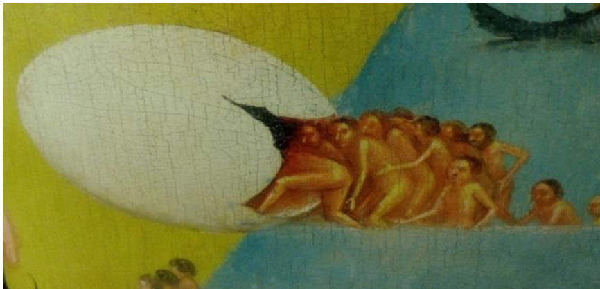
Fig.4 El huevo en la Unidad Final (en cada pincelada una comunicación doble) Ubicación: espacio superior de la tabla central de El Jardín de las delicias .

Podría considerarse como otra representación de la Unidad Final, desde la perspectiva del huevo órfico, el postigo (cf. https://es.wikipedia.org/wiki/Visión_del_Más_Allá ) de La Ascensión al Empíreo (cf. imagen completa en Wikipedia supra y en Fischer 2016: 312): la parte superior de la tabla evoca una galaxia esférica -dentro de la armonía de las esferas, la música universal de los pitagóricos- en retracción -Big Crunch de la Física actual- formada por líneas concéntricas, que termina en un huevo-órfico-celestial, asimilable también a un 'agujero blanco' -en oposición a los llamados 'agujeros negros'- o a la esfera del Sol platónico.