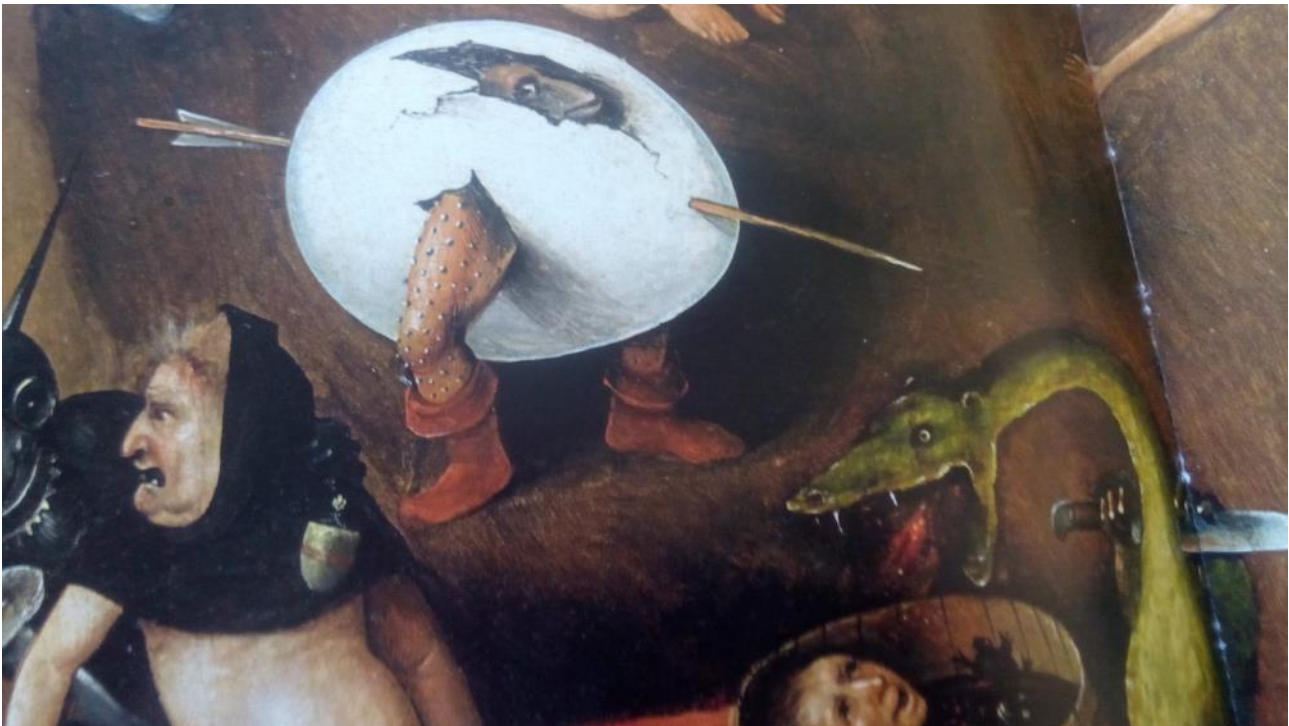
Fig.3 Arriba: el huevo órfico del que surge Dioniso dios de los Contrarios identificado con Fanes y la fuerza primigenia de Eros simbolizado aquí con la flecha que rompe el huevo.

En la fig.3, Dioniso rompe, junto con la fuerza primigenia del arco de Eros , el huevo cósmico-primordial, el huevo órfico , del que surge con un aspecto semejante a como aparece en otros espacios de la obra de El Bosco: desde su escondite , semioculto, agazapado, dispuesto a funcionar como cazador de almas.