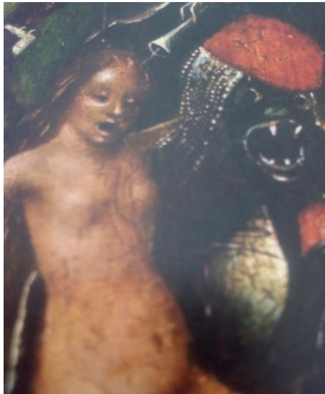
Fig.7 Perséfone poseída: su brazo, sobre el esposo fiero Dioniso, en cuyo centro se ve el otro rostro, amable, del dios dual; su vientre, huevo órfico, evidencia la creación de vida , que desde la Unidad Madre-Hija surgirá -explosión expansiva- en la fragmentación -alumbramiento- del sparagmós .

Ubicación: espacio inferior -el Hades, la muerte- de la tabla derecha de El Juicio Final .