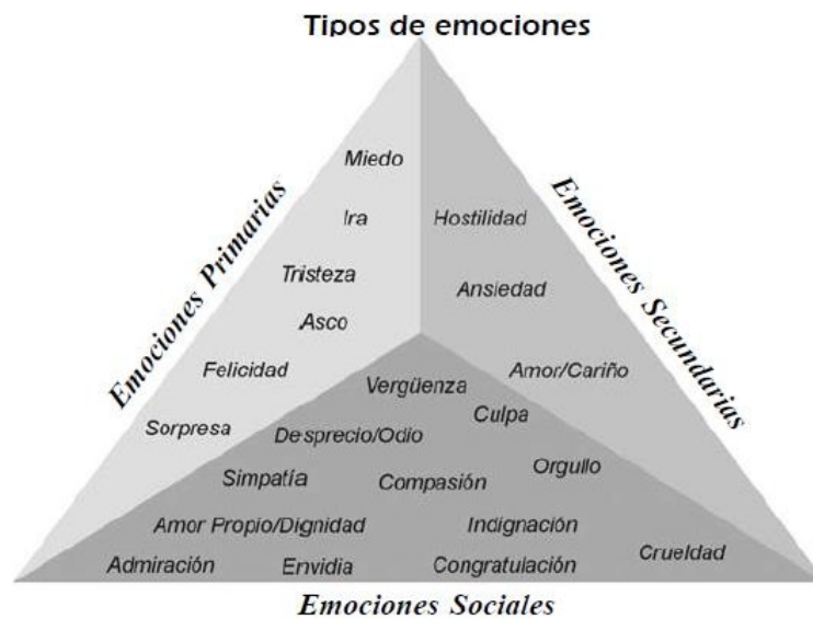
Figura 1: Clasificación de las emociones según Vivas et al. (2007)

A continuación se describen cada una de las distintas emociones primarias, que son las que se van a trabajar en este proyecto: