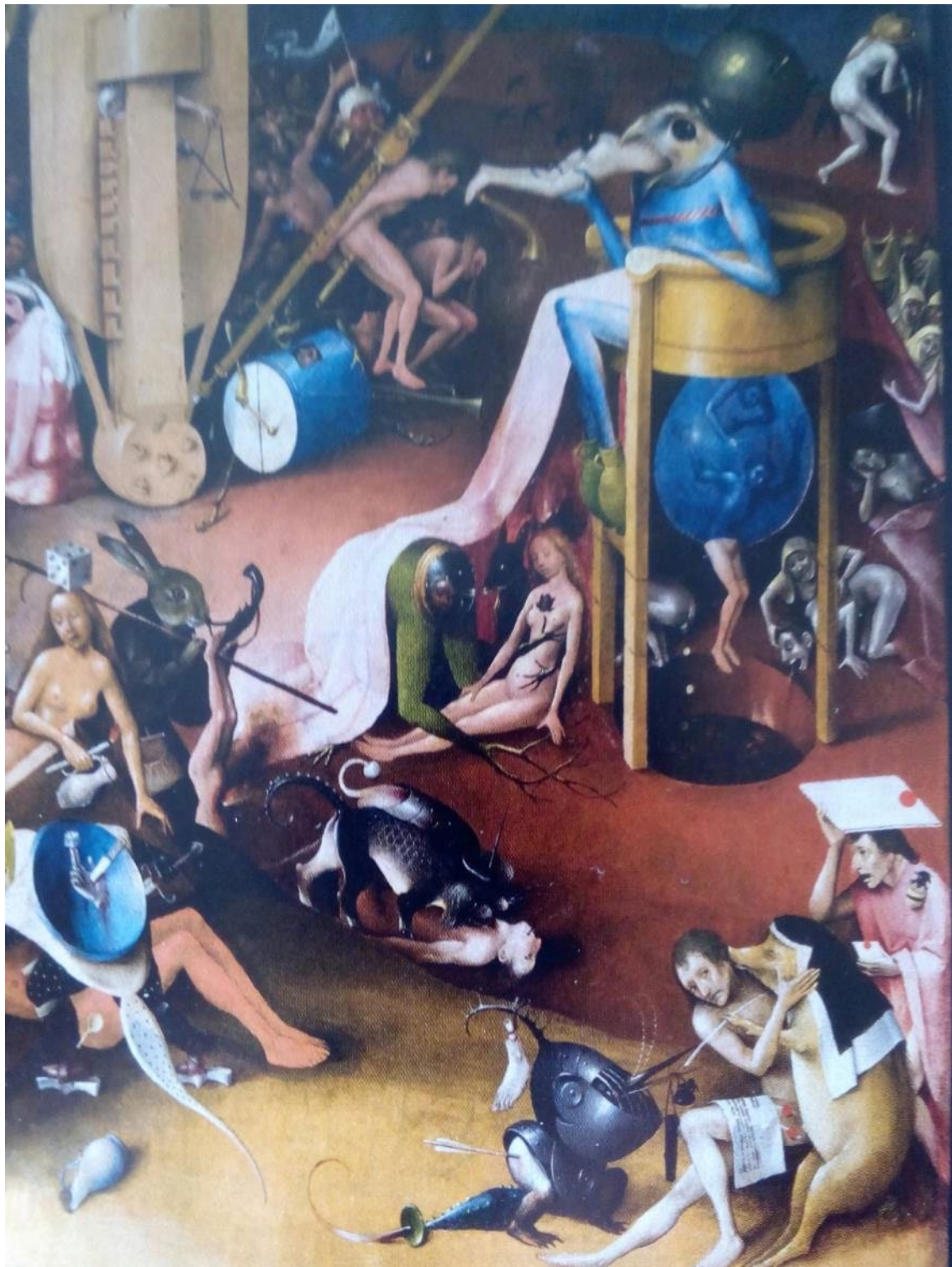
Fig.1 Tabla derecha espacio inferior: en el centro -físico y del contenido- el espejo.