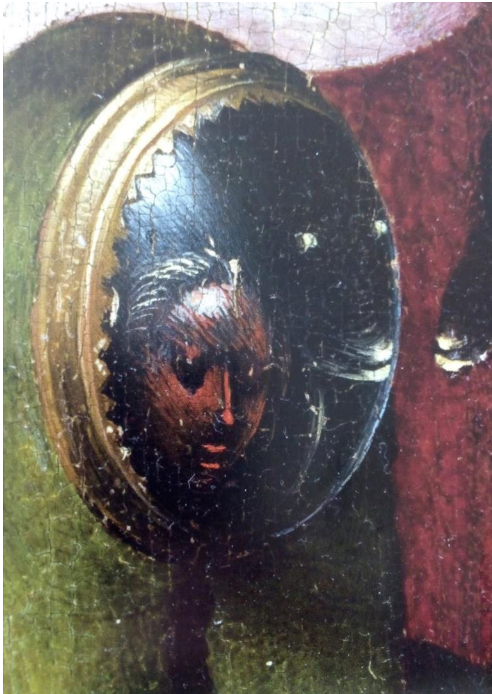
Fig.4 Estructura superficial de la estructura profunda y estructura profunda de la estructura superficial: la magia del espejo, el myto y El Bosco

La tercera dualidad deriva de la propia naturaleza de Dioniso-dual : El Bosco la recoge en su rostro dúplice : dos pares de ojos y un par de bocas, reflejando su alma bipolar (cf. figuras 2 y 4) Aparece también en la parte superior-izquierda el rostro luminoso, místico, del dios frente a su imagen oscura de la derecha.