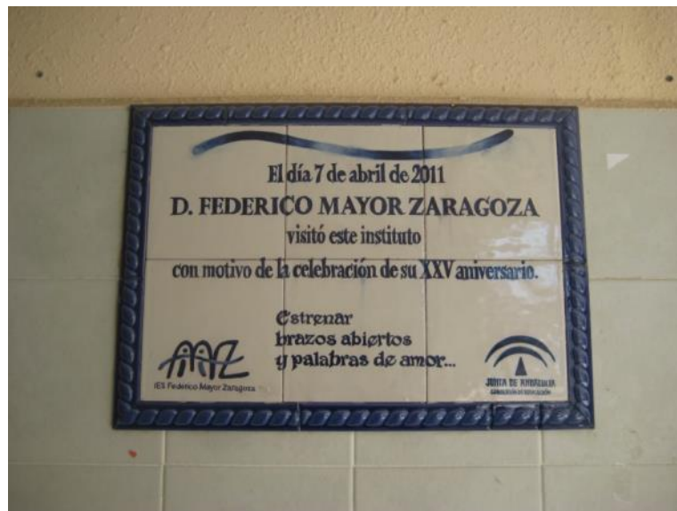
Imagen 1: placa conmemorativa del XXV aniversario del centro.

Debe su nombre a una circunstancia curiosa: un gran número de profesores de la rama de sanidad habían sido alumnos del propio Mayor Zaragoza. En el año 2011 se celebró el XXV aniversario del centro y acudió a visitarlo él mismo.