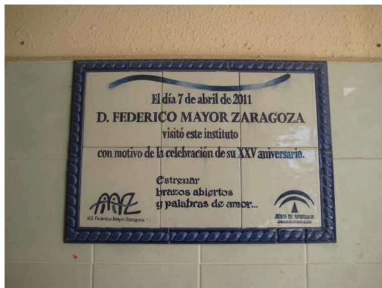
Imagen 1: placa conmemorativa del XXV aniversario del centro.

Debe su nombre a una circunstancia curiosa: un gran número de profesores de la rama de sanidad habían sido alumnos del propio Mayor Zaragoza. En el año 2011 se celebró el XXV aniversario del centro y acudió a visitarlo él mismo.