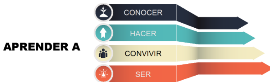
Fig. Pilares de la educación para el siglo XXI (Delors, 1996)

Derivado de lo antes señalado, el objetivo de este artículo es analizar las interrelaciones existentes entre los pilares de la educación para el siglo XXI y la inclusión educativa, considerando las oportunidades que con esta última se generan para alcanzar el logro de los referidos pilares, sin cuya materialización sería difícil juzgar acerca de los resultados de la transformación que la educación y la sociedad actual reclaman.