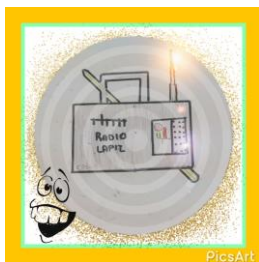
Ilustración 1: Logotipo creado por los alumnos de Plasencia de Jalón

Para finalizar no nos queda más que agradecer el apoyo recibido por parte de toda la comunidad educativa que forma el CRA Lumpiaque y en particular del aula de Plasencia de Jalón y animar a continuar con este proyecto y seguir innovando en las aulas.