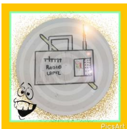
Ilustración 1: Logotipo creado por los alumnos de Plasencia de Jalón

Para finalizar no nos queda más que agradecer el apoyo recibido por parte de toda la comunidad educativa que forma el CRA Lumpiaque y en particular del aula de Plasencia de Jalón y animar a continuar con este proyecto y seguir innovando en las aulas.