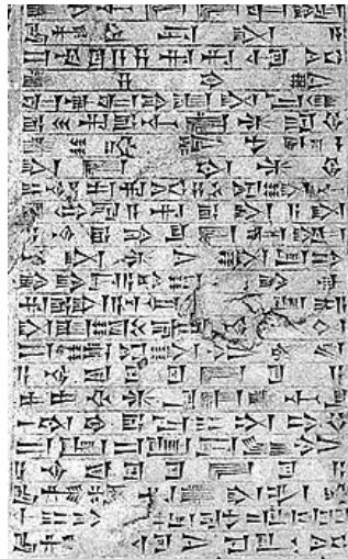
Imagen 3. Ejemplo de escritura acadia