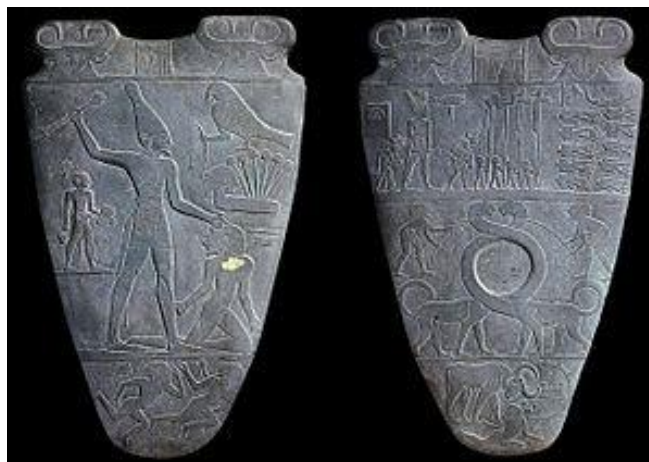
Imagen 4. La Paleta de Narmer

La Paleta del rey Narmer es uno de los testimonios más antiguos e importantes del Período Predinástico del Antiguo Egipto. En realidad se trata de una paleta cosmética, es decir, una losa de piedra con una cavidad central en la que se mezclaban los pigmentos para el maquillaje personal. En aquella época, no obstante, las paletas adquirieron una función puramente conmemorativa y se fabricaban con materiales preciosos. La de Narmer es de esquisto, de forma casi triangular, de 64 x 42 cm, y está fechada alrededor del año 3000 a. C. Fue hallada en 1898 entre las reliquias del templo de Horus en Hierakonpolis, en las proximidades de Edfu, y actualmente se conserva en el Museo Egipcio de El Cairo. Narmer, también identificado como Menes, es el primer rey registrado en la Lista Real de Abydos, que recoge los nombres de casi todos los faraones que gobernaron en el Valle del Nilo. Es considerado el fundador de la I Dinastía y uno de los principales iniciadores de la organización del Estado egipcio. El análisis iconográfico de esta paleta revela el propósito de glorificación de la figura de Narmer y permite entender la significación política de su reinado. La obra está grabada con relieves por ambas caras y documentan la lucha por unificar el norte y el sur del país.