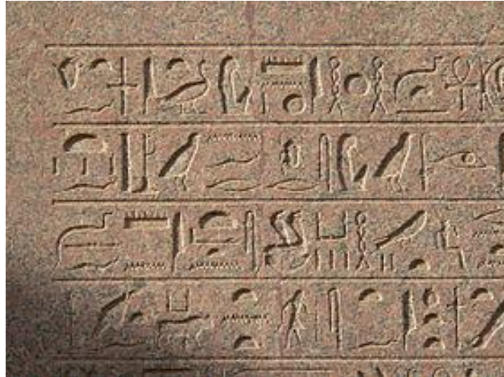
Imagen 5. Ejemplo de escritura jeroglífica egipcia