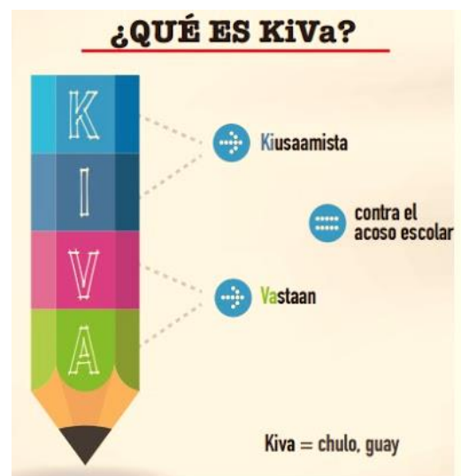
Figura 2. Origen de KiVa

El programa se inició en 2007 y ha tenido un gran éxito, en tanto que el 90% de los centros de Finlandia ya lo emplean y han reducido el acoso escolar en un 70%. Las familias de los niños/as llegan a elegir aquellos colegios que poseen este método. Además, ha merecido reconocimientos internacionales y se ha exportado a otros países como Francia, Italia, Reino Unido, Suecia, Bélgica y Estados Unidos bajando hasta un 30 y un 50% desde que entró en vigor. En España, podemos apreciarlo en numerosos colegios como el centro Internacional Torrequebrada de Benalmádena (Málaga), el centro Docente Privado Extranjero Escuela Finlandesa de Fuengirola (Málaga) y el colegio Escandinavo de Madrid, entre otros.