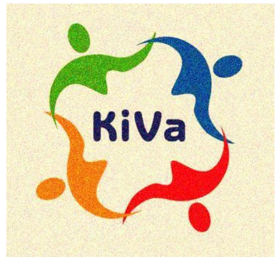
Figura 1. El método KiVa

El acrónimo KiVa está cada día que pasa en boca de más docentes porque se considera la solución capaz de solventar la lamentable situación que estamos viviendo. Muchos/as de los/as expertos/as ya han pedido a los centros que intervengan sobre este problema que afecta a nuestra sociedad, para que adopten medidas dirigidas a prevenirla y hacerla desaparecer. Pero, ¿Y a qué esperamos para poner en práctica esta metodología? "No es tan sencillo" avisa Xavier Melgarejo, experto en el sistema educativo finlandés. La mayoría de los protocolos para prevenir el acoso es diferente a este método, porque tiene el foco de atención en castigar al/a la acosador/a y consolar a la víctima. Esta medida tiende a agravar aún más el bullying. En cambio, este programa no solo aborda estas dos figuras de esta esfera de terror, sino que además, trabaja con todo el grupo, los/as que observan, los/as que se ríen, los/as que guardan silencio. Tan culpables son como el/la acosador/a y deben ser educados/as por igual. Principalmente se persigue que todos/as aquellos/as implicados/as o no, empaticen con la víctima.