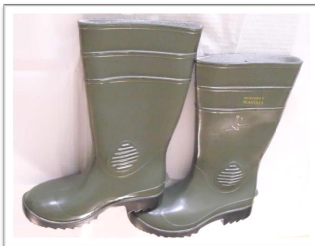
Ejemplo de botas de goma.

Las botas deberán de ser de goma, de media caña de altura, sin fieltro en su interior y a ser posible con suela antideslizante y puntera reforzada.