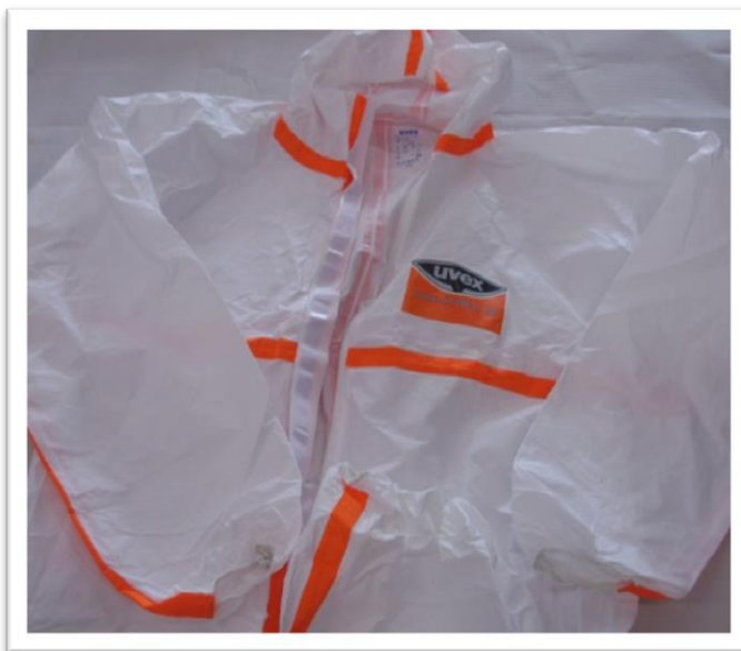
Ejemplo de traje para tratamientos fitosanitarios.

En el caso que nos ocupa el más recomendable es el de tipo 4, puesto que en la mayoría de las prácticas que se realizan con los alumnos se emplean equipos de pulverización tanto hidráulica como hidroneumática.