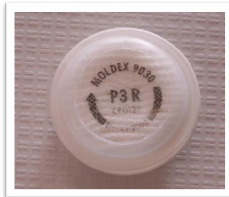
Filtro mecánico para mascarilla con un poder de retención de partículas sólidas de tipo alto P3

En el caso de los filtros mecánicos, se clasifica su poder de retención en bajo, medio y alto, siendo el bajo P1, el medio P2 y el alto P3