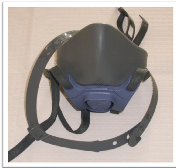
Mascarilla con correas ajustables para realizar un adecuado ajuste.

Para un buen uso de la mascarilla se deberá, en el caso masculino de tener la barba completamente rasurada, de esta manera el sellado de la mascarilla con la cara es óptimo y garantiza que no se produzca espacios por donde pueda penetrar el producto fitosanitario por vía respiratoria.