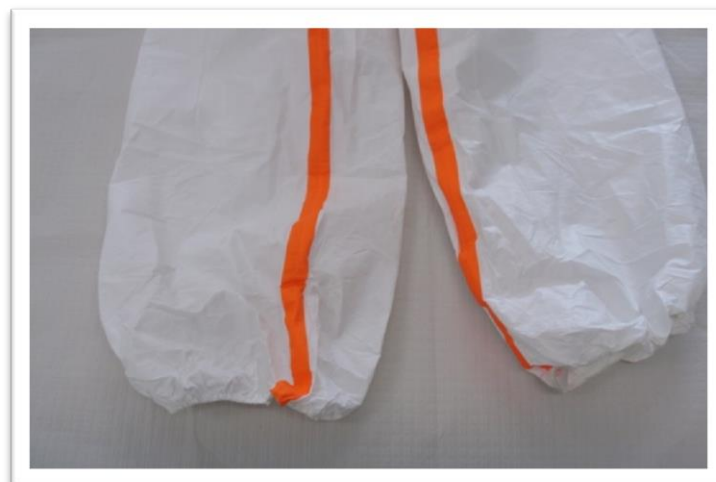
Detalle de gomas ajustables en perneras del traje.