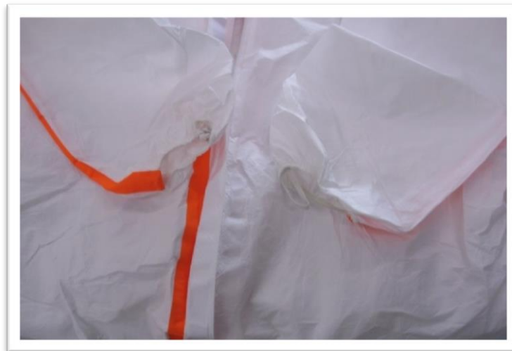
Detalle de gomas ajustables en mangas del traje.