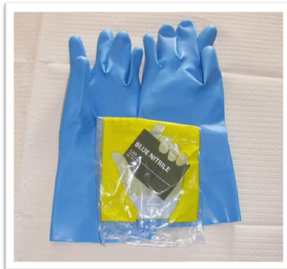
Ejemplo de guantes de Nitrilo

Es importante el uso de guantes de nitrilo, pues el uso de otro tipo de material de fabricación de los guantes, puede no resultar adecuado, debido que al entrar en contacto con el producto fitosanitario puede generar una reacción de descomposición del material. (Por norma general el Nitrilo tiene mayor resistencia a los productos químicos).