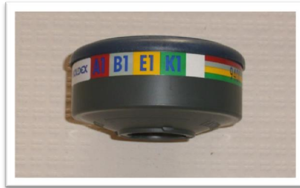
Filtro químico para mascarilla donde se pueden apreciar los colores, letras y números que indican el tipo de gas o vapor que filtran así como el grado de retención de los mismos.

En el caso de los filtros mecánicos, se clasifica su poder de retención en bajo, medio y alto, siendo el bajo P1, el medio P2 y el alto P3