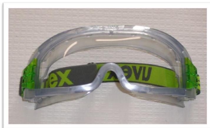
Ejemplo de gafas para la protección ocular de productos fitosanitarios

Estas, como mínimo deben de cubrir completamente los ojos y además deben de ajustar perfectamente a la cara, de tal manera que no quede espacio por el cual pueda penetrar producto fitosanitario por vía conjuntival.