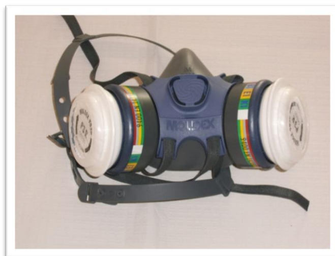
Ejemplo de mascarilla buco-nasal montada con flitros mecánicos y químicos