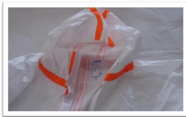
Detalle de capucha con goma ajustable del traje.