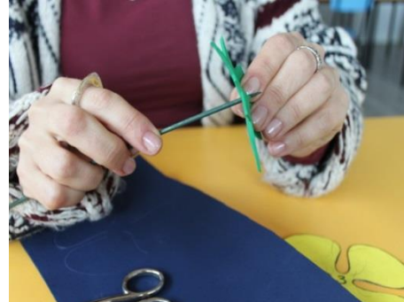
Fases del proceso