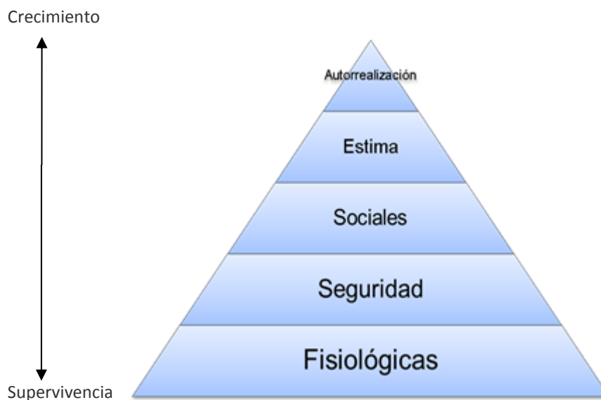
Figura 1. Pirámide de Maslow (1943).

Maslow (1943), propone que el ser humano necesita satisfacer unas necesidades o motivaciones, tal y como se muestra en la tabla 6, y para ello elaboró una jerarquía de cinco niveles, que plantea que el ser humano pasa entre ellas en orden de prioridad, y solamente cuando haya cubierto esas necesidades, pasarán a las siguientes, de tal modo que en la parte de la base de la pirámide, son las que pertenece a las necesidades básicas, tal como se muestra en la figura 1.