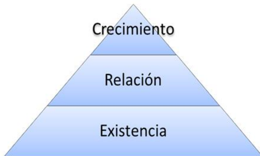
Figura 2. Pirámide de Alderfer (1969).

Alderfer (1969), elaboró una teoría de tres necesidades básicas, tal como se muestra en la figura 2. Esas necesidades no eran nuevas, ya que se relacionan con las de Maslow (1943), como las necesidades de exigencia que estarían relacionadas con las fisiológicas y de seguridad, las de relación relacionada con las de afiliación y estima o reconocimiento y la de crecimiento relacionado con la de autorregulación,